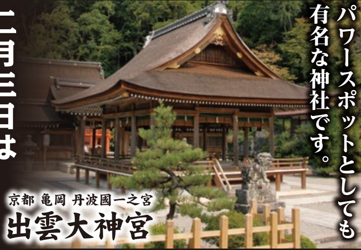
京都 亀岡 丹波國一之宮 出雲大神宮